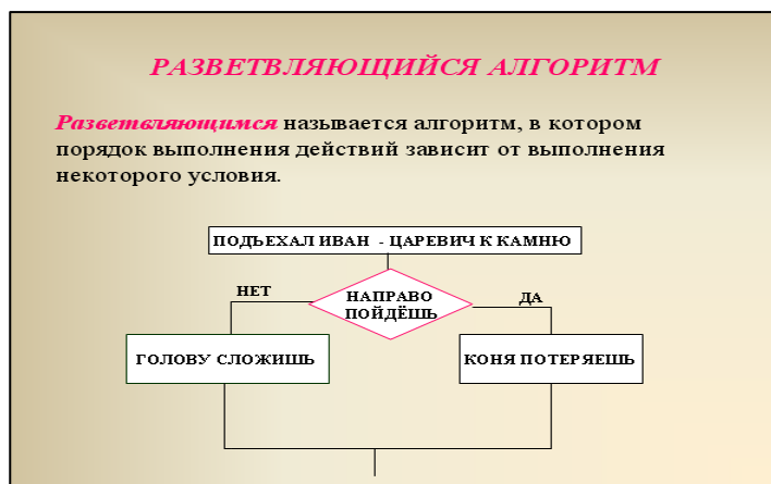
Рисунок 3 - Пример слайда.

Каждый слайд КП должен иметь заголовок, количество слов на слайде не должно превышать 40 (Рисунок 3).